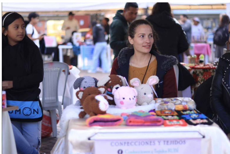
Emprendimientos dentro de la Buena Práctica