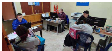
Asesoramiento y asistencia humanitaria