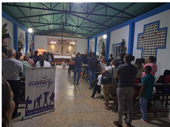
Celebración de misa en comunidad