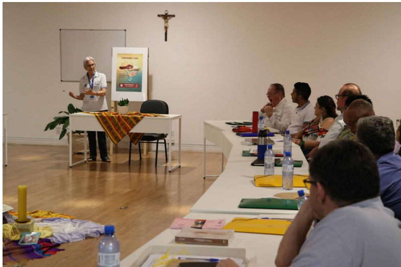
IX Encuentro Nacional de Pastorales Sociales de la Movilidad Humana