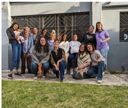
Mujeres embarazadas y madres, luego de haber participado de uno de los encuentros de Latidos.