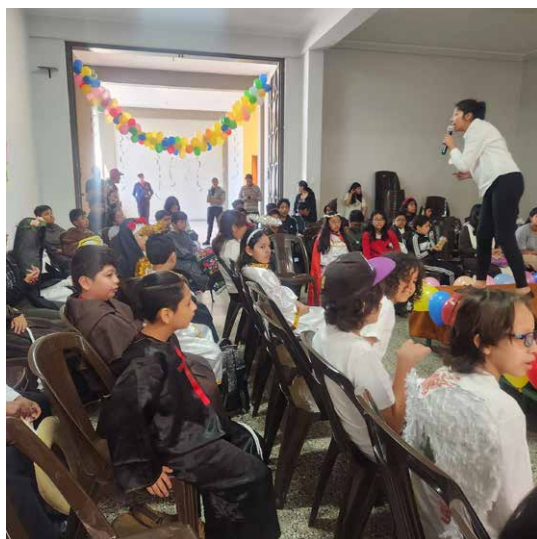
Un grupo de niños participando de una de las actividades didácticas como parte de la buena práctica.