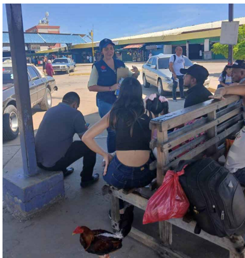
Atención a personas en movilidad en terminales de micro de Maracaibo, Venezuela.