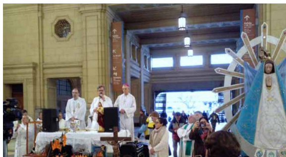
Misa contra la Trata de Personas y Excluidos. Plaza Constitución.