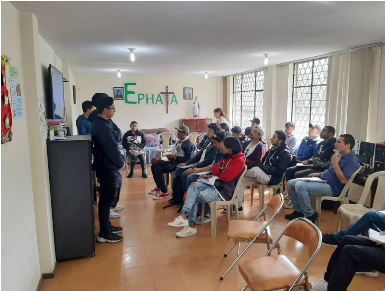
Sesión de acompañamiento espiritual por voluntarios.