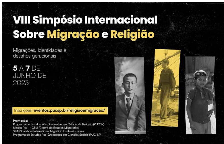
Flyer de difusión del evento