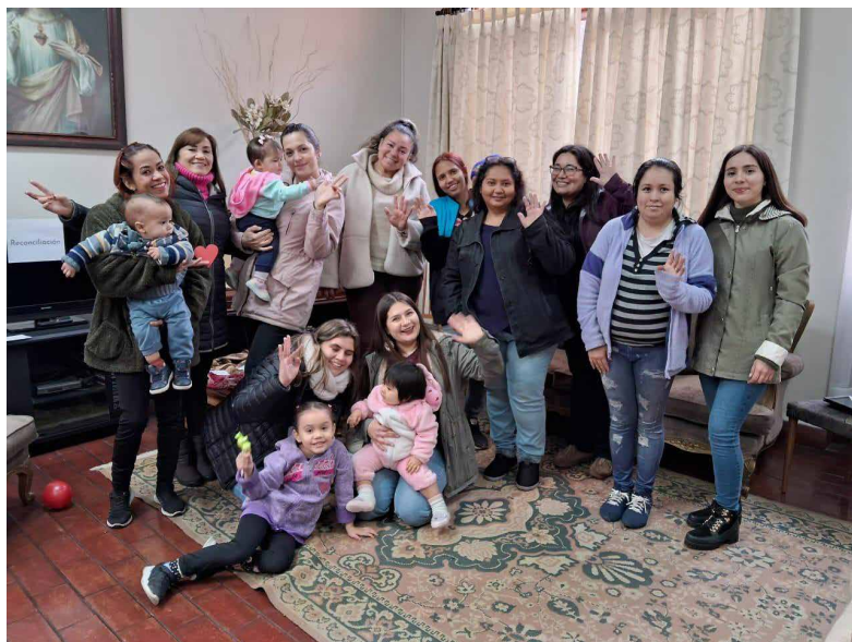
Taller realizado desde el Centro de Atención al Migrante (CAM) de Santiago, Región Metropolitana