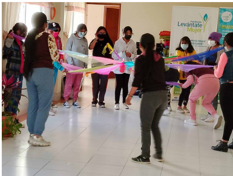
Adolescentes víctimas de violencia sexual comparten una sesión de danza