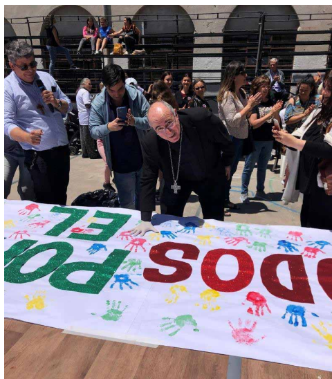
Otra de las actividades conjuntas consistió en la elaboración de una pancarta en la que todos los participantes dejaron su huella