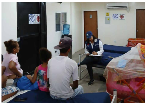
Atención psicológica y espiritual en las casas de paso o de alojamiento temporario para migrantes que llegan o salen de Venezuela.