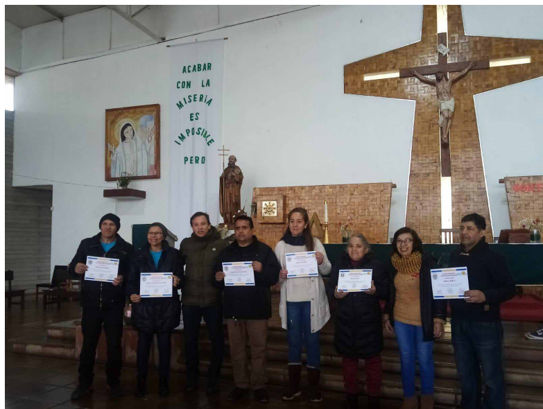
Agentes pastorales con diploma de formación en "Movilidad Humana y Pastoral Migrante"