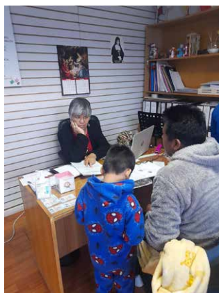
Operativos INCAMI regularización NNA