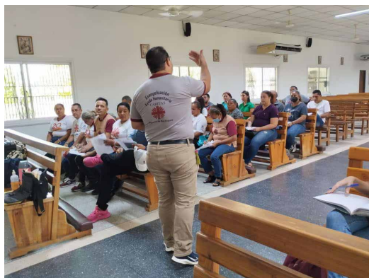
Acompañamiento psicoespiritual y espiritual en Machiques, Venezuela.