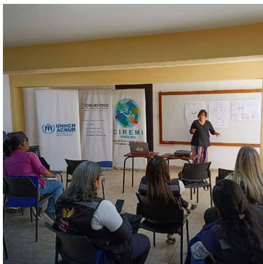
Taller encuentro organizado en Arequipa como parte del programa.