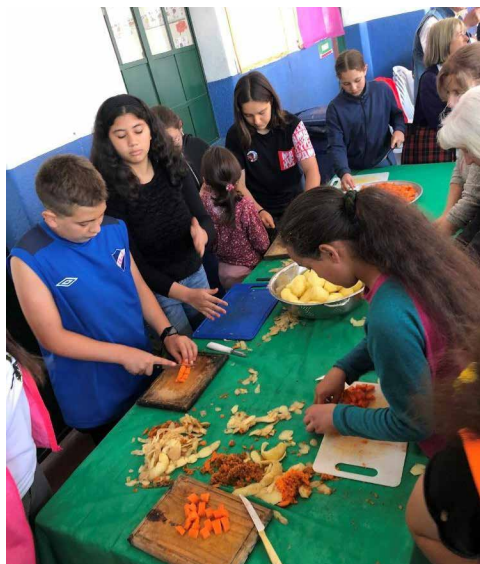
Participantes de la Jornada de Pastoral Social cocinan juntos