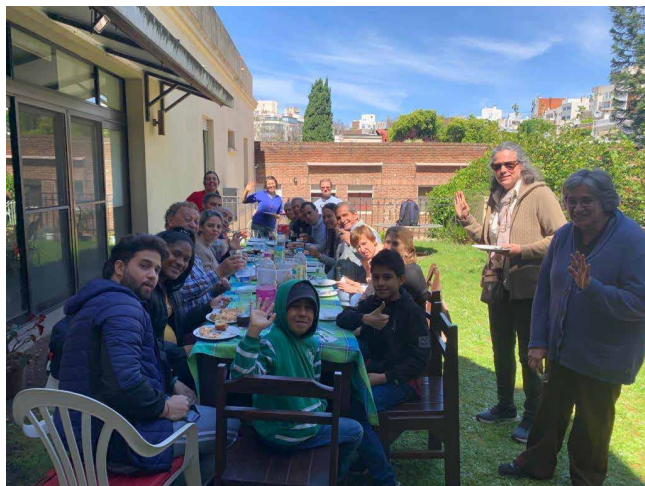
Participantes y equipo del SJM ARU comparten la mesa en una de las Jornadas de Encuentros de Amistad y Oración.