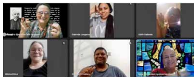
10º Encuentro Virtual/Red Oración Scalabriniana Migrante. 09/10/2023 Tema: Un año de Canonización de San Juan Bautista SCALABRINI. Protector de los migrantes