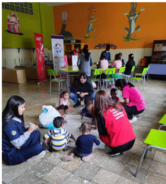
Espacio de recreación para los niños mientras sus madres disfrutan de una mesa de reflexión.