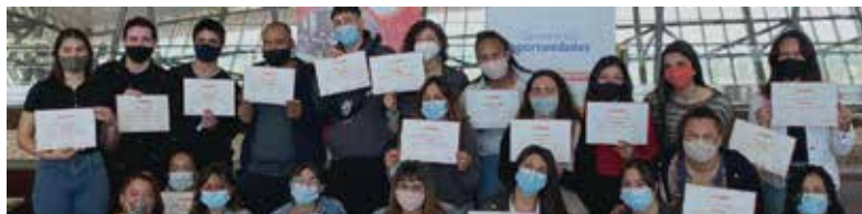
Jóvenes concluyendo su participación en el programa.