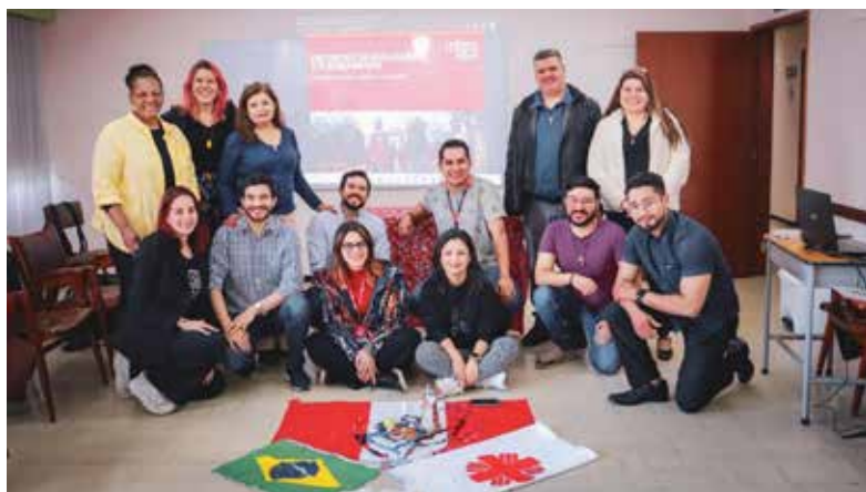
Encuentro de Evaluación y Planificación del proyecto Migrasegura en Bogotá, Colombia.