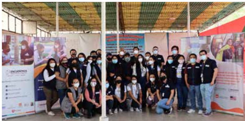
El equipo de Encuentros Servicio Jesuita a Migrantes realizando la investigación de campo.