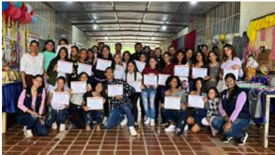
Beneficiarios de la Buena Práctica