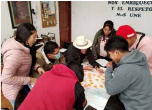
Jóvenes realizando diversas actividades, a través de las cuales eliminan barreras culturales y se identifican como hermanos.

Video ilustrativo: https://drive.google.com/file/d/1nSBLsi53yyW3ulHTrSxt_M-BJnQq86Dt/view?usp=drivesdk