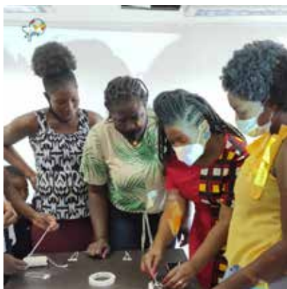
Las 30 mujeres beneficiarias participando de uno de los talleres de formación.