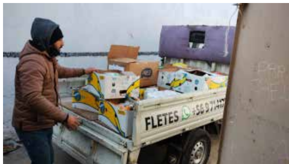
"Camión de la vida" distribuye ayuda alimentaria.