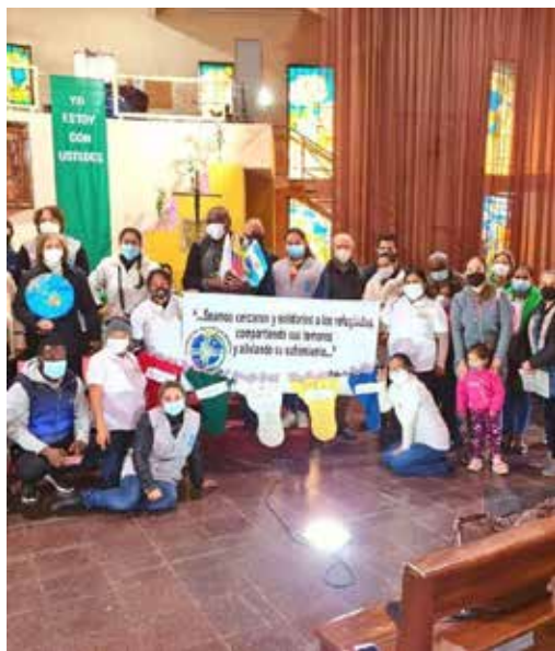
Migrantes acogidos y trabajadores de la Casa de Acogida Juntos.