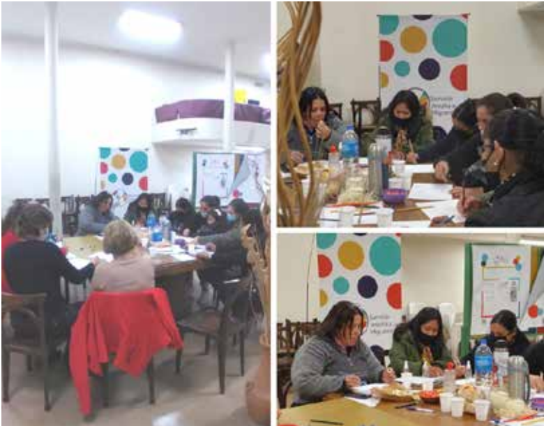
Círculo de Mujeres en Córdoba, provincia de Argentina.

Publicación encuentro de las 4 oficinas en 2023: https://sjmargentina.org/encuentro-circulo-de-mujeres-argentina/