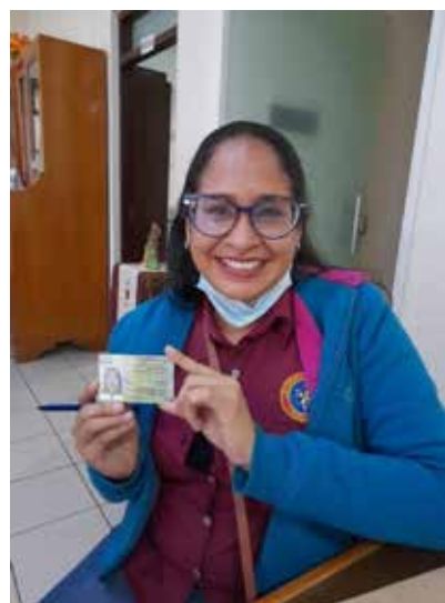
Migrantes recibiendo su documentación.