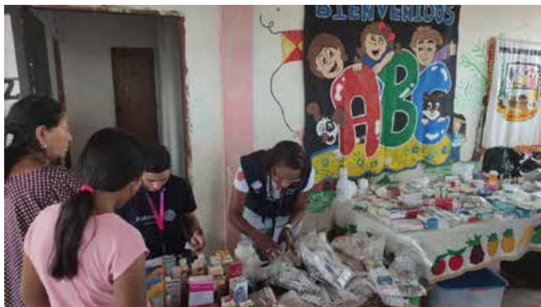
Jornadas de atención de salud y provisión de medicamentos