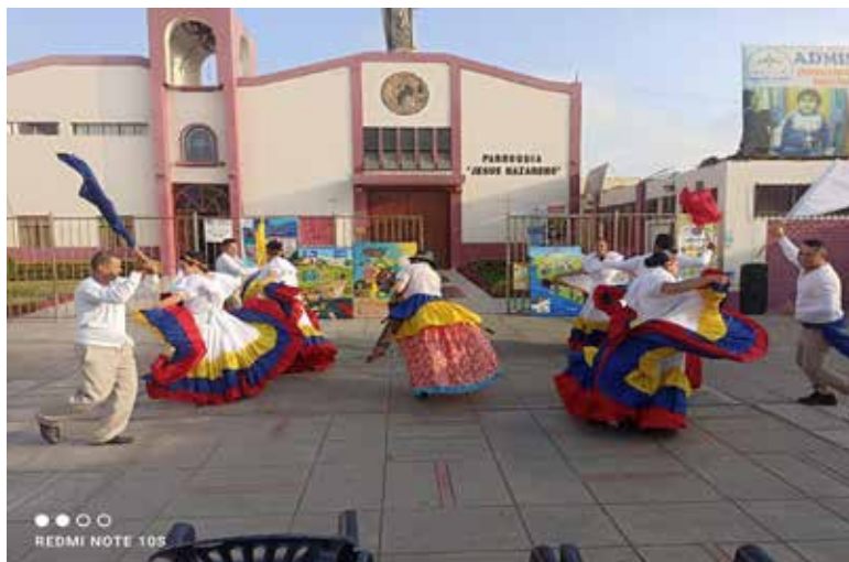
Un grupo de migrantes bailando El Burro, un baile típico de Venezuela, en frente de la parroquia Jesús Nazareno.