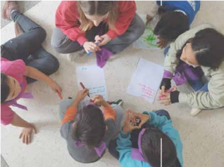
Niños y Adolescentes participando de las diversas actividades de los talleres.