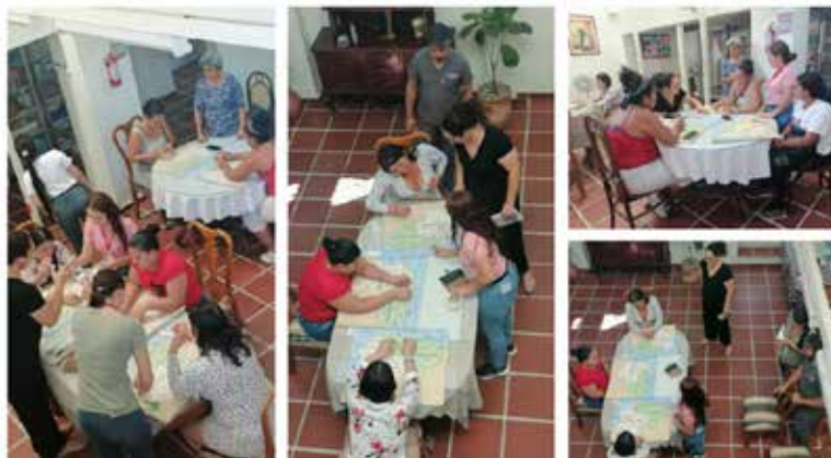
Talleres de prevención de trata