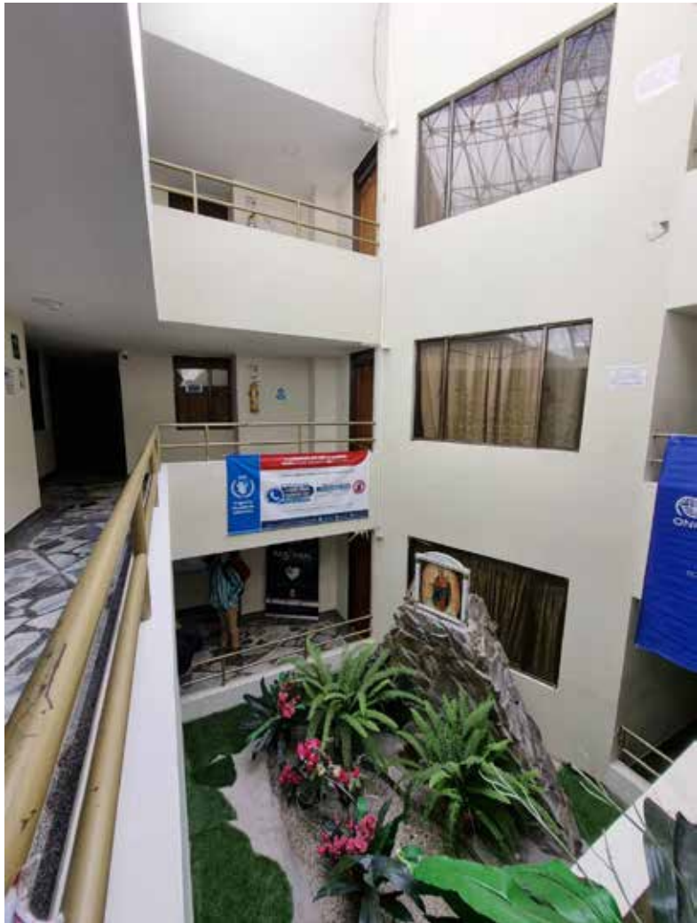
Espacio de alojamiento - Pastoral Social de Ipiales