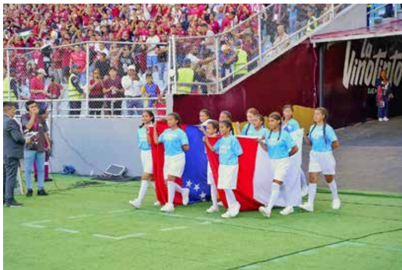
Niñas de la Academia de fútbol ingresando en el partido de Venezuela vs. Chile por las eliminatorias para el Mundial de 2026.