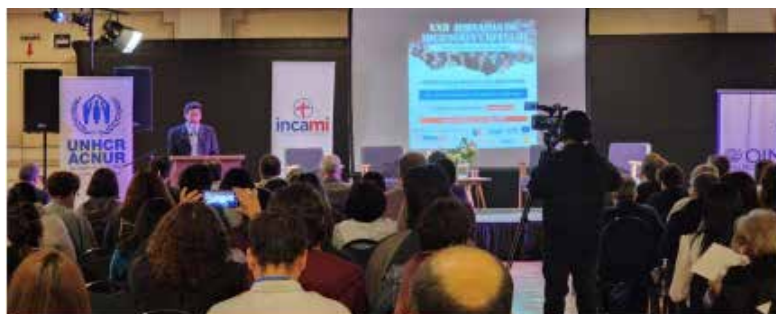
Jornada de Migración y Refugio 2022