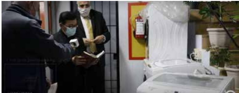
Bendición en la inauguración de la Lavandería Doña Marta.