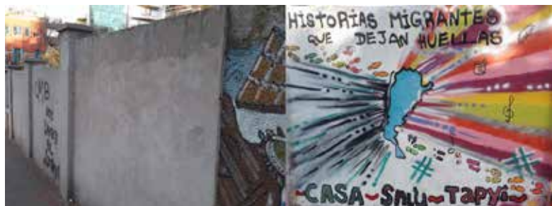
Pared a intervenir antes y luego del mural.