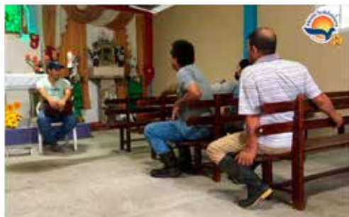
Dando a conocer la metodología GAAP en la parroquia El Eno de la localidad de Sucumbios - 17 de junio de 2022.