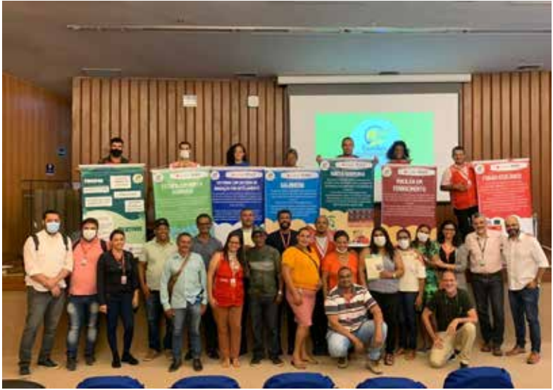
Momento de entrega de los 100 patios ecoproductivos en el Complejo Portuario Industrial de Suape.