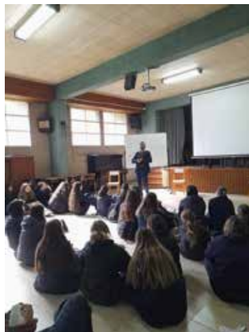
Encuentro de reflexión: "Relatos de Migración"