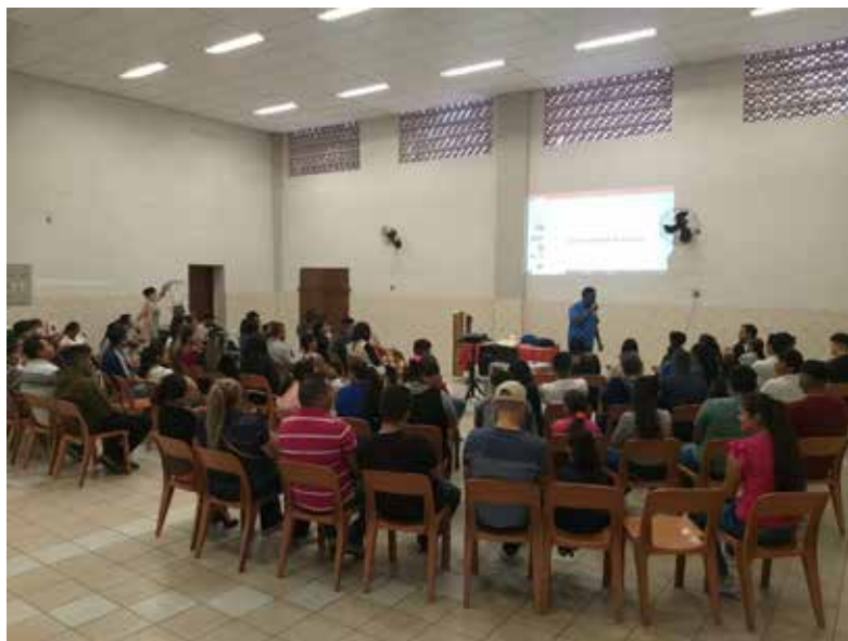
Un grupo de migrantes cursando uno de los programas de formación de Missao Paz.