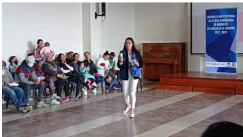
Eventos de asesoramiento jurídico